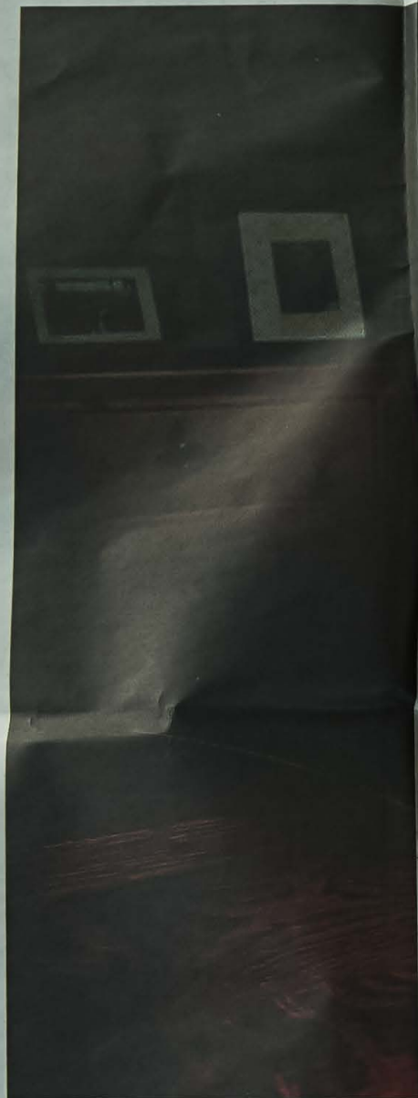
Een levensalbum met foto's, verhalen, tekeningen, voorwerpen en opnames van geliefde liedjes kan een houvast bieden voor herinneringen.