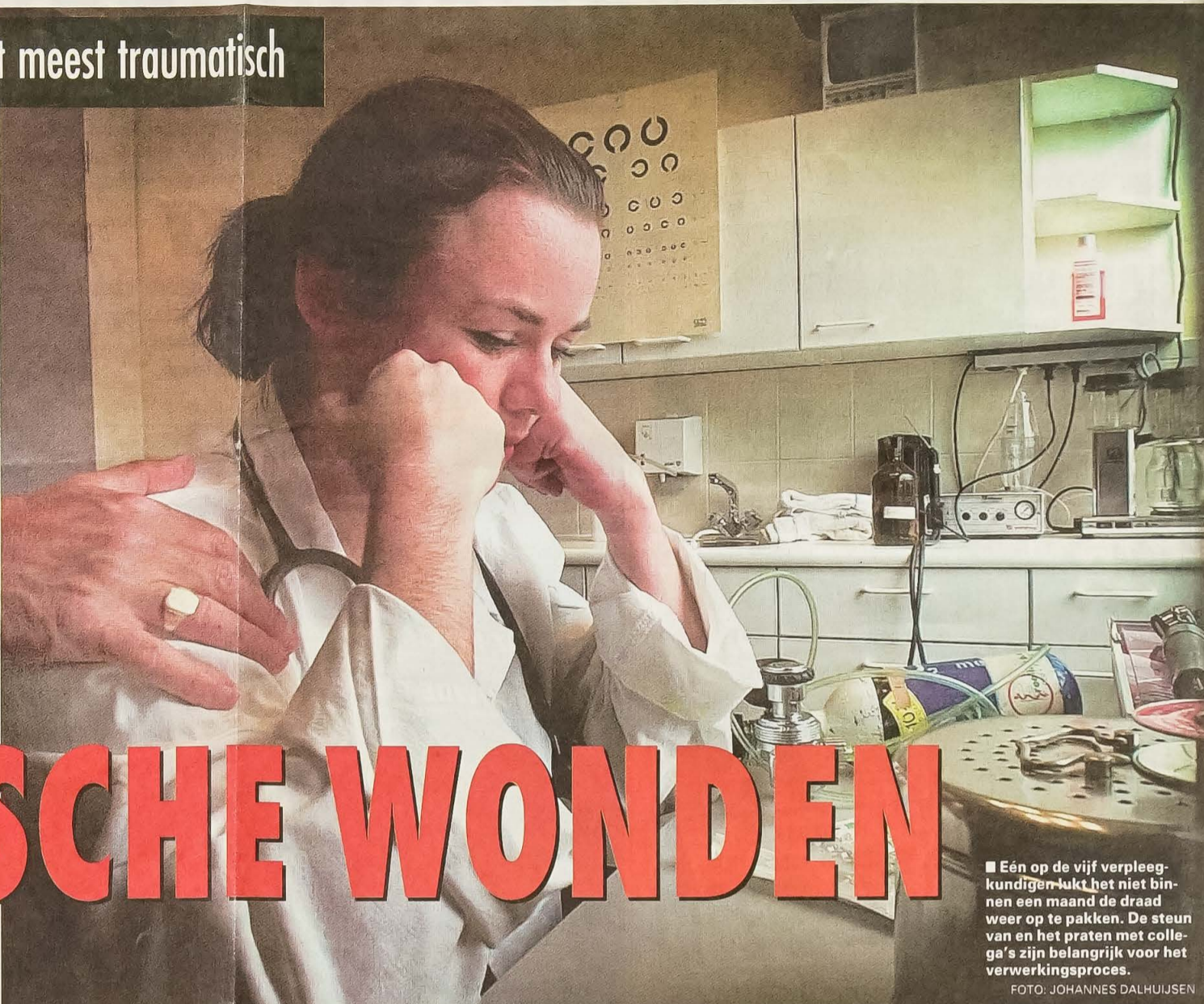
■ Eén op de vijf verpleegkundigen lukt het niet binnen een maand de draad weer op te pakken. De steun van en het praten met collega's zijn belangrijk voor het verwerkingsproces.